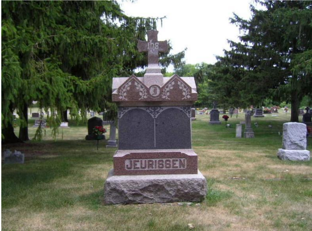
Jeurissen grafsteen op het St. Hubert Kerkhof te Chanhassen, MN