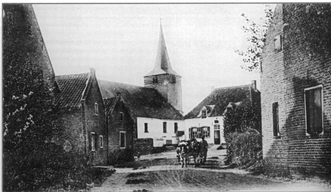
Born dorp, rond 1900 4