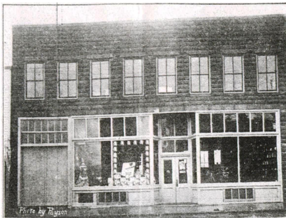
Deuhs & Lano hardware store in Long Prairie, MN